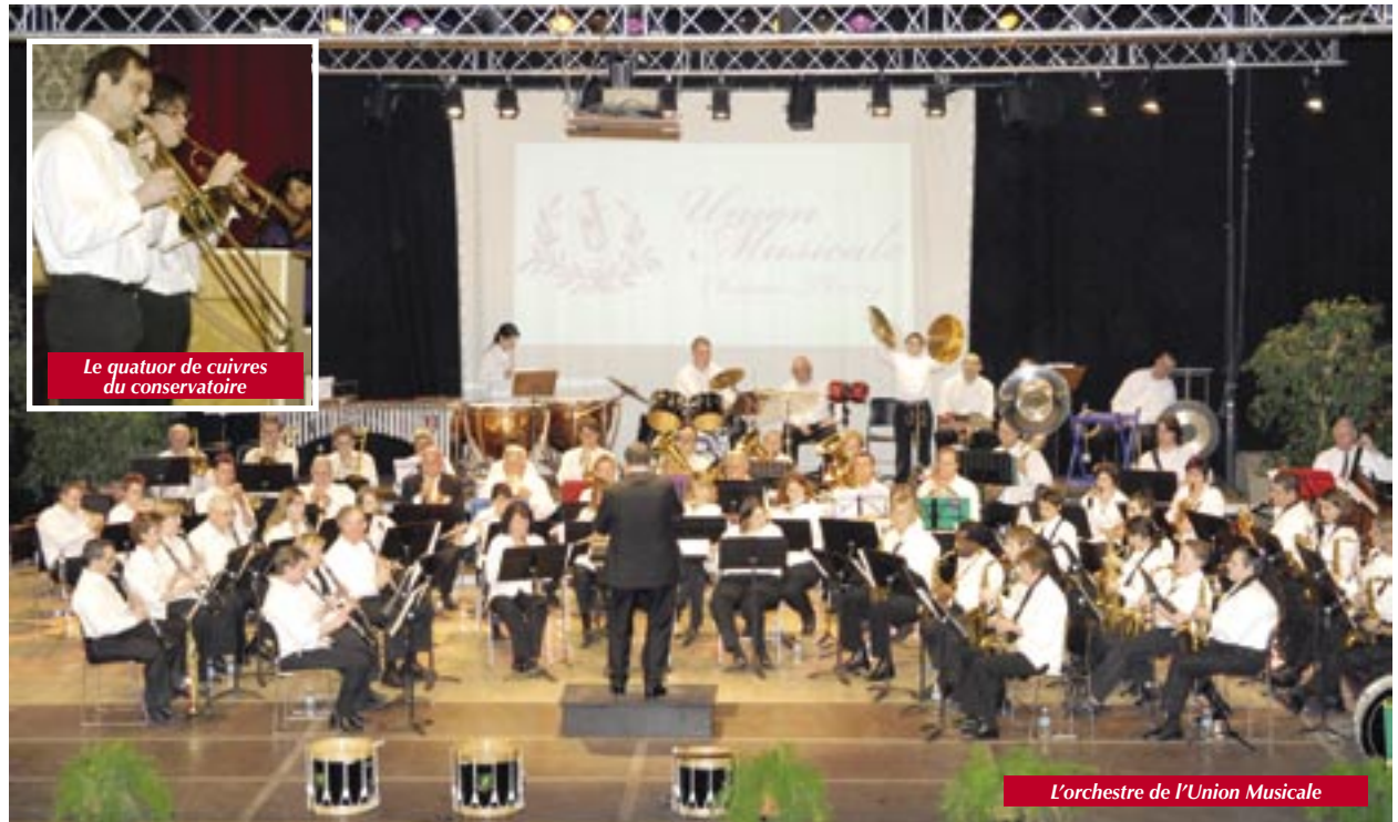
Le quatuor de cuivres du conservatoire