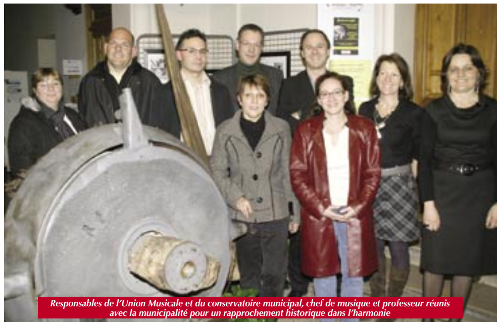
Responsables de l'Union Musicale et du conservatoire municipal, chef de musique et professeur réunis avec la municipalité pour un rapprochement historique dans l'harmonie

L'entrée sera gratuite mais attention : la salle est limitée à 300 places et les retardataires risquent de rester sur la touche... ■