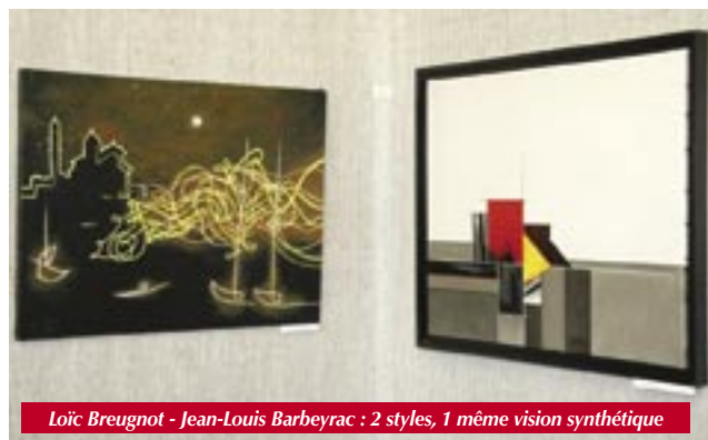
Loïc Breugnot - Jean-Louis Barbeyrac : 2 styles, 1 même vision synthétique