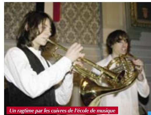
Un ragtime par les cuivres de l'école de musique